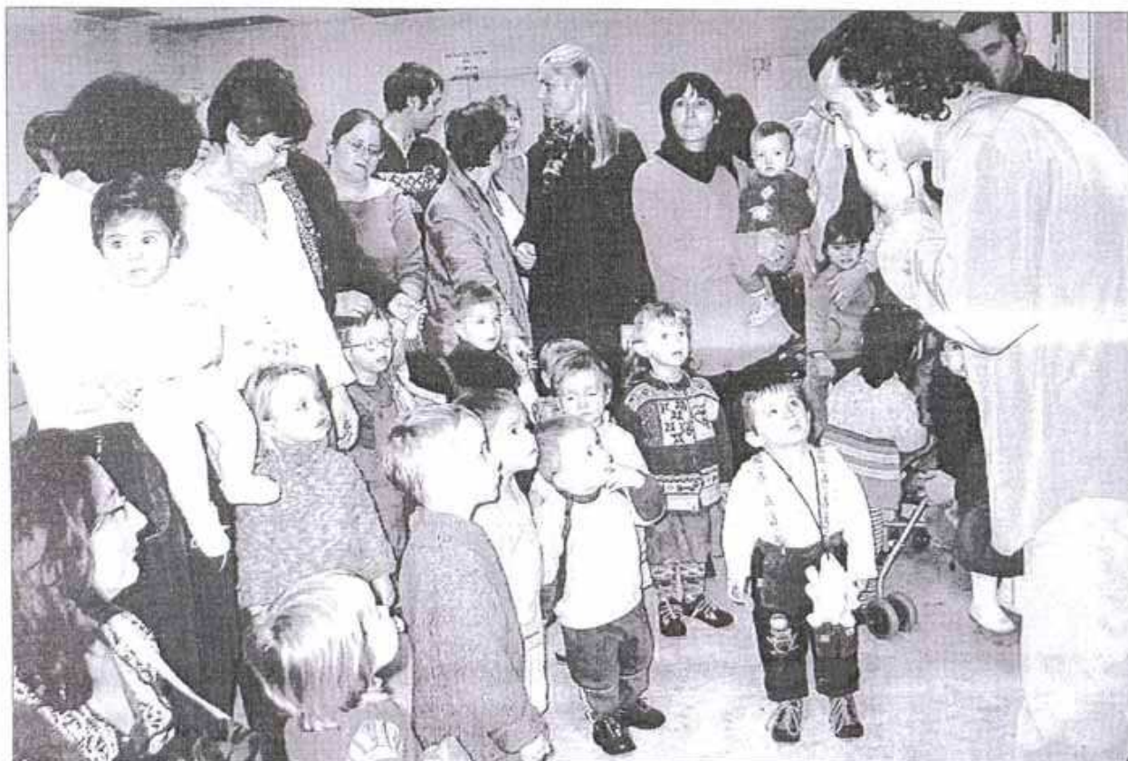
Avant d'entrer dans le vif du sujet, l'artiste explique le déroulement du spectacle aux plus petits.

Dans le cadre de l'itinérance Circuit Biscuit d'un spectacle pour la petite enfance dans le département, la ville de Joué-lès-Tours, en partenariat avec la Caf Touraine et