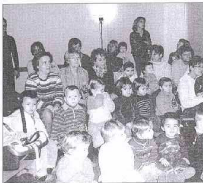
Les enfants subjugués par le spectacle.