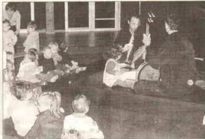
Un spectacle ludique où les enfants ont ouvert tout grands les yeux et les oreilles.

Dans le cadre de Circuit biscuit festival jeune public, Véretz recevait « Toot Ouïe » de la compagnie Ramodal, salle E.-Bizeau. Quatre-vingts à cent personnes, bien sûr beaucoup d'enfants accompagnés par leurs parents, étaient regroupés autour des musiciens et acteurs de la troupe qui ont emmené tout leur petit monde dans un univers magique et sonore.