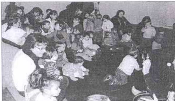
Les enfants devant la scène écoutent les musiciens.

Dans les prochains jours ce sont les petits enfants de Luynes, de Saint-Cyr, de La Riche, puis la semaine d'après de Fondettes, Saint-Avertin et Monts, etc. qui recevront la visite de l'itinérance Circuit Biscuit.